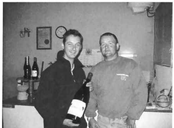
Quand l'Alsace et la Touraine se rencontrent...

Nous y serons à nouveau cette année et nous vous y donnons d'ores et déjà rendez-vous !